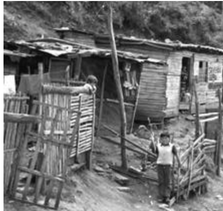
Un'abitazione alla periferia di Bogotà

La cosa che più impressiona giungendo in Colombia è la situazione di violenza, di guerra civile in cui si vive. Da una parte ci sono un governo ed un esercito che da sempre difendono gli interessi dei grandi latifondisti, i quali da alcuni decenni hanno creato dei gruppi paramilitari (alcune decine di migliaia) per difendere meglio le loro terre che sono in genere dedicate all'allevamento dei bovini, alla coltivazione di cocaina o lasciate incolte. Dall'altra parte ci sono i vari gruppi guerriglieri nati negli ultimi 50 anni da poveri che hanno visto nella violenza armata l'unica speranza di cambiare la società: si mantengono con i fondi raccolti attraverso i sequestri di persona e con il