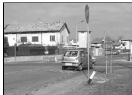
L'incrocio di San Salvatore

L'esito positivo della conferenza di servizi