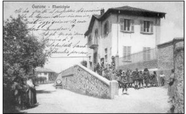
Il vecchio municipio di Gurone in una cartolina d'epoca