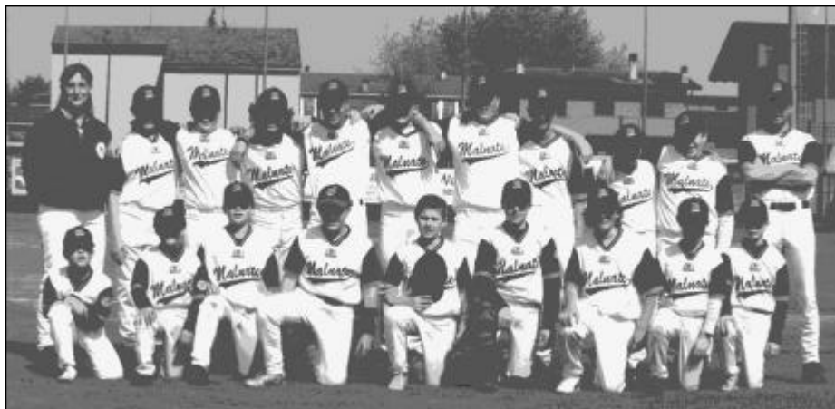
La formazione dei Vikings con "vecchi" talenti e nuove promesse del baseball

Negli anni recenti il Baseball Malnate, ormai ribattezzatosi Vikings, si è fatto luce nel campionato di serie C1 nazionale, con ottimi