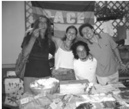
Un gruppo di volontari al banchetto di Mani Tese

Inoltre, ci siamo fortemente impegnati nell'attività di sensibilizzazione del territorio