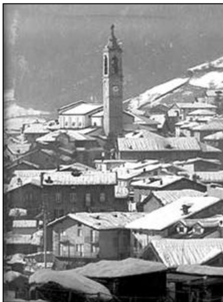
Panorama invernale di Schilpario

L'avventura ha avuto inizio con la visita al Museo Faunistico, a Vilminore, dove abbi- amo apprezzato una splendida collezione di animali della Val di Scalve e di tutte le preal- pi Orobiche, riuniti in diorami raffiguranti il succedersi delle varie stagioni nell'ambiente originario. Subito dopo, una visita alle anti- che prigioni del paese, tutte foderate di legno e immerse nel buio più totale. E ancora, un saluto religioso alle suore del Convento vici- no, simpaticissime e pimpanti anziane che ci hanno fatto festa e sollecitato a pregare per