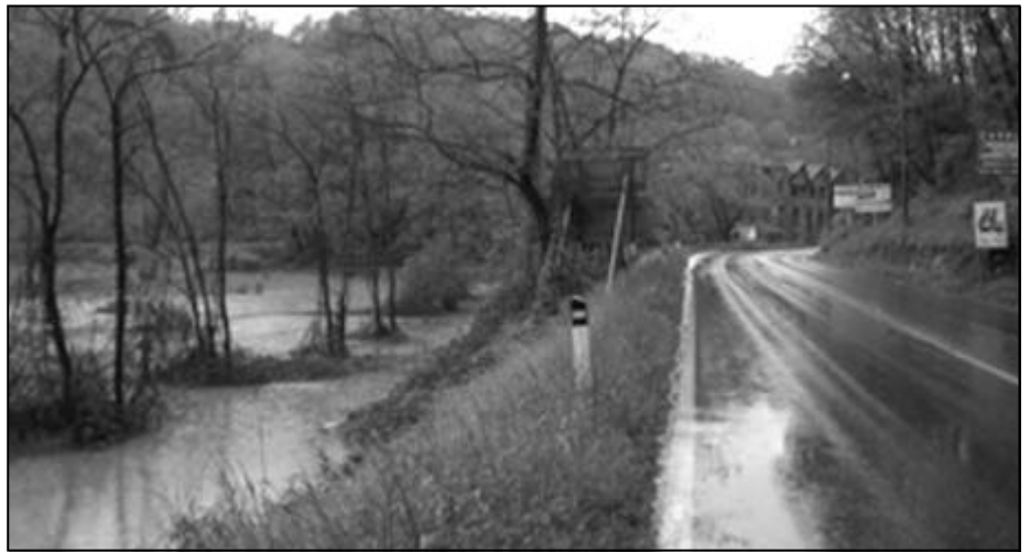
Qui sopra e nella foto sotto: immagini di una delle ultime esondazioni dell'Olonza alla Folla

Vorremmo chiedere al Presidente Reguzzoni cosa ne pensa degli amministratori che hanno consentito di costruire sulle rive del fiume, cementificandolo e privandolo delle naturali aree di sfogo? E cosa ne pensa di quegli industriali che hanno "approfittato" della poca "lungimiranza" dei suddetti amministratori, sfruttando il fiume per anni, magari anche devianandone il corso, e che oggi pretendono un intervento pubblico (pagato quindi con i soldi di tutti) per risolvere un problema che loro stessi hanno creato?